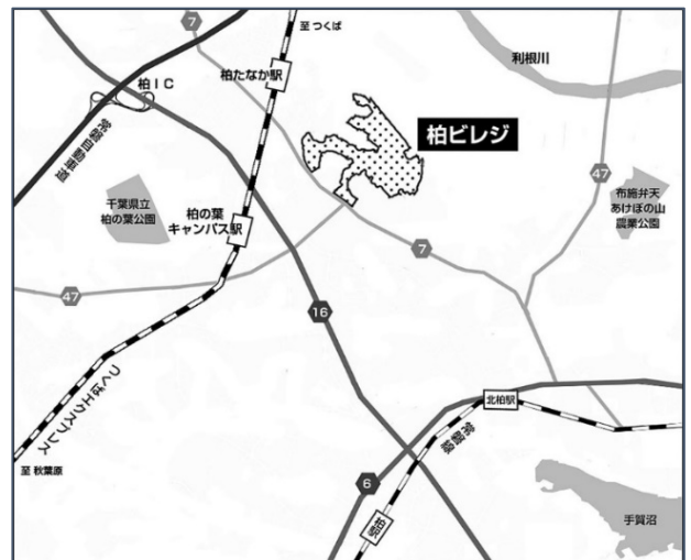
（資料② 柏ビレジ広域図）