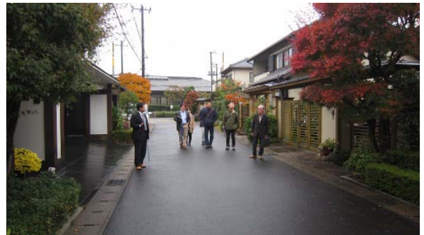
（浅川先生の案内で、住宅地見学）