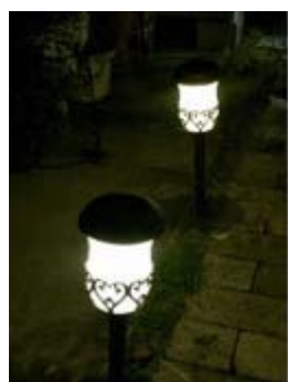
本年度の活動で 59 本設置