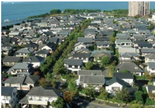
南側から見た百道浜4丁目戸建地区(図中①)