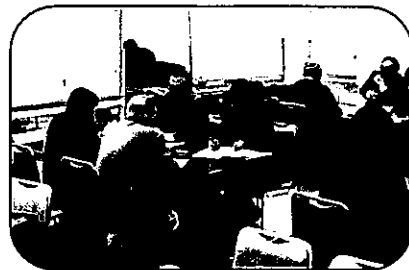
<過年度の相談会の様子>