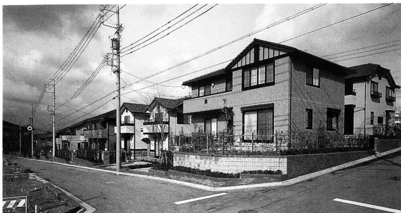
道路側に庭を配置し、植栽のスペースを多くとっている